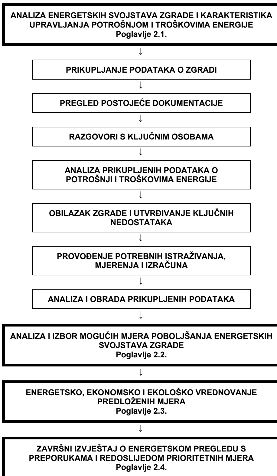
Slika 1: Prikaz toka provođenja energetskeg pregleda